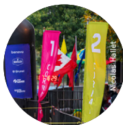
Exemple de corralle de départ sur le terrain.

POUR PLUS DE DÉTAILS, VISITE NOTRE SITE WEB EN CLIQUANT ICI