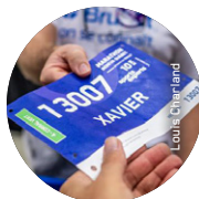
Exemple de corral de départ sur le dossard.