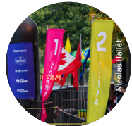
Exemple de corral de départ sur le terrain.

POUR PLUS DE DÉTAILS, VISITE NOTRE SITE WEB EN CLIQUANT ICI