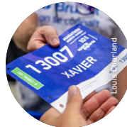
Exemple de corral de départ sur le dossard.