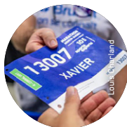
Exemple de corralle de départ sur le dossard.