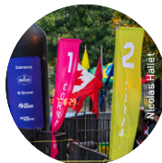
Exemple de corral de départ sur le terrain.

POUR PLUS DE DÉTAILS, VISITE NOTRE SITE WEB EN CLIQUANT ICI