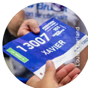
Exemple de corral de départ sur le dossier.